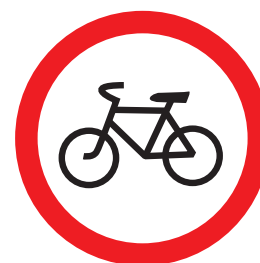
3.9. «Движение на велосипедах запрещено»