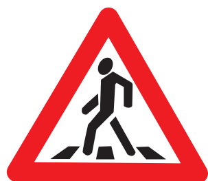
1.22 «Пешеходный переход»