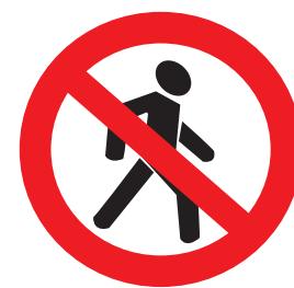
3.10. «Движение пешеходов запрещено»