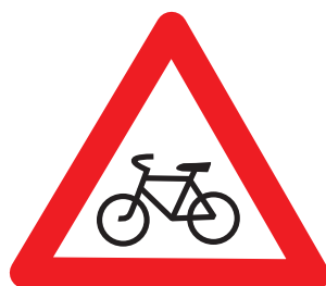
1.24. «Пересечение с велосипедной или велопешеходной дорожкой»