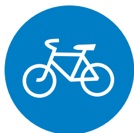
4.4.1. «Велосипедная дорожка»