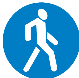
4.5.1. «Пешеходная дорожка»