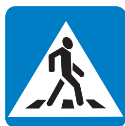
5.19.2 «Пешеходный переход»