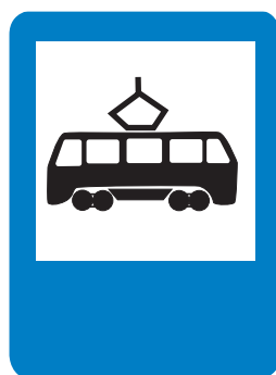
5.17. «Место остановки трамвая»